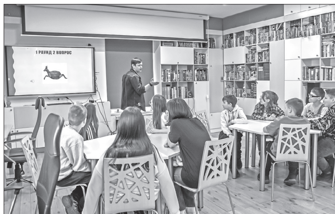
▲ При подготовке квиза очень важно наличие необходимого оборудования...

«В квизе каждый зачитываемый ведущим вопрос обязательно должен дублироваться текстом на экране или листе бумаги. Отсчёт времени нужно начинать только после того, как было озвучено задание».