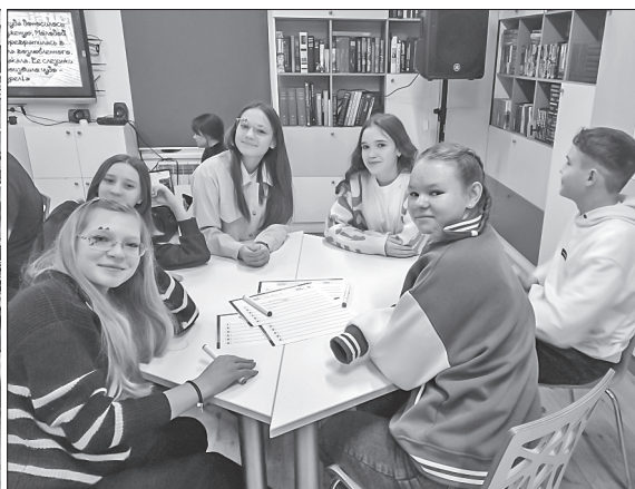
▲ ...Презентация с интересными ребусами и загадками поможет разнообразить гейм-процесс